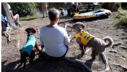
Die Perros beobachten ganz genau die Fortschritte ihrer Freunde

Bei herrlicher Nachtruhe in sternenklarer Dunkelheit sah man auf dem Gassikehr noch kleine Lichtkegel von Stirnleuchten und Smartphones und hörte die leisen Zurufe „Gute Nacht, schläft gut!“